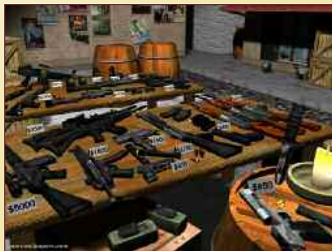
Counter Strike fegyverbolt

állandósítják a játékos agresszív, torzult gondolkodásmódját és érzéseit. Ez pedig kedvez az agresszív magatartás kialakulásának, egyúttal csökkenti az együttérző emberi, társas viselkedést. Az erőszakos számítógépes játékok használata különösen azoknál a fiataloknál okoz agresszív viselkedést, és alakít ki ennek megfelelő szemé-